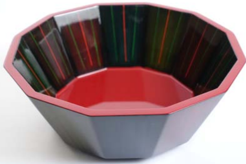
公益財団法人日本デザイン振興会賞 [12角鉢(彩)] 畑 勝日佐(高岡漆器)

12面体の鉢の色彩が美しく、漆独自の溜漆色、朱色と各面でバランス良く構成され、その中の各面に多色の細線で縞状に色漆の模様が描かれ、明るく楽しいボールになっている。