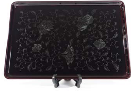
一般社団法人日本漆工協会会長賞 [長手盆] 市中漆器工房(輪島塗)

朱溜めのあたたかく奥深い味わいは、漆器ならではのものだ。秘めた表現、その点をよく心得た作品で器の形とよく調和し、さらにかくし味として、金粉による葛文様を沈めている。ほんのりとした白檀文様が浮かんで深い味わいをそえた美しい作品である。