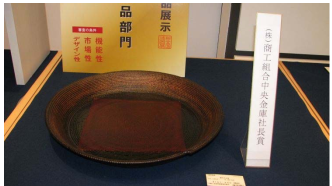
株式会社商工組合中央金庫社長賞 [紐の大丸盆] 上野 和成 (高岡)