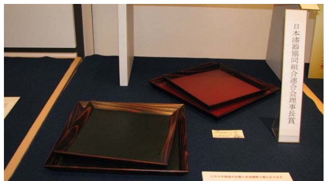
日本漆器協同組合連合会理事長賞 [秋田杉乾漆各盆セット] 摂津 広紀 (秋田)