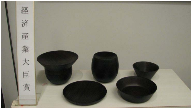
経済産業大臣賞 [KOTON black V、(Y)、(U)] 我戸 正幸 (山中)