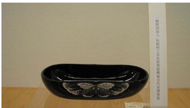
一般財団法人伝統的工芸品産業振興協会代表理事賞