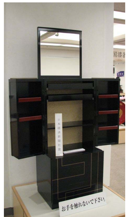
日本経済新聞社賞