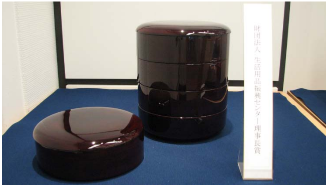
財団法人生活用品振興センター理事長賞 [呂色磨紅溜(ろいろみがきべにため)5段重8寸]