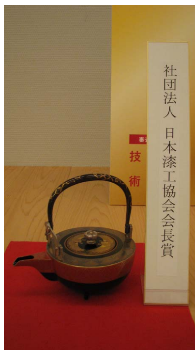
社団法人日本漆工協会会長賞

色漆の塗り分けによって微妙な色彩効果を生み出しているところが魅力となっている。おもてなしに使ってみたいくなる作品である。そこには線彫りによって四君子の表現が的確であり、技術を賞味する話題を提供してくれる作品である。