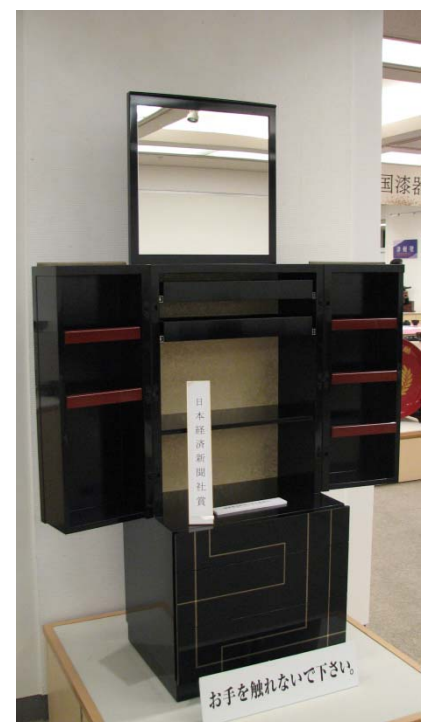
日本経済新聞社賞

この作品は、なんといっても加賀時絵の伝統をしっかりと継承していて、しかも全体として新鮮な表現構成にまとめているところである。伝統の技あつての魅力で、現代感覚と表現力によって新たな可能性ありを見事に示している。